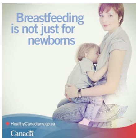
Figure 2. Breastfeeding is not just for newborns

L'affiche Breastfeeding is not just for newborns (figure 2), est emblématique de la sémiologie du lien mère-enfant avec le choix des vêtements identiques, d'une tonalité de bleus, d'une même coupe de cheveu : un allaitement qui illustre les liens d'attachements mais qui rompt avec le discours social et culturel sur l'allaitement. On montre une autre position d'allaitement que celle de « la madone ». La mère ne regarde plus son enfant. Elle nous regarde d'un air confiant. L'enfant doit avoir dans les deux/trois ans, âge à partir duquel on commence à parler du sevrage naturel. Il y a peu de place au cadre situationnel mais une mère et son fils, rompant ainsi avec la théorie freudienne de l'Œdipe et illustrant plutôt la théorie de l'attachement de John Bowlby.