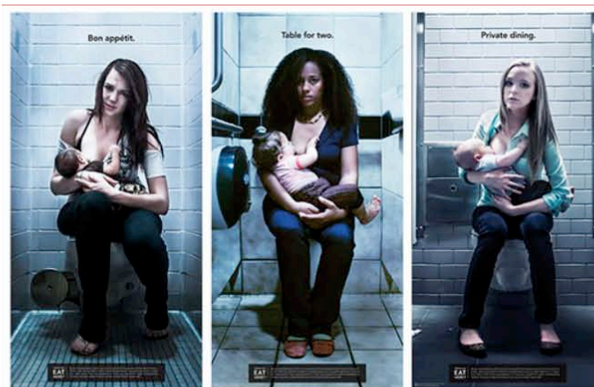
Figure 1. Would you eat here ?

Une image d'Épinal de l'allaitement se caractérise par une polarisation sur l'objet substantiel « sein » (fond blanc/clair, peu de place au cadre, gros plan sur le bébé qui a le sein dans la bouche ou mise en scène de la mère allaitante yeux dans les yeux avec son bébé et mise en valeur esthétique de ses attributs nourriciers) réduisant ainsi le sens de l'allaitement à sa fonction nourricière et produisant des images iconiques de la femme-objet. On a longtemps trouvé ce type d'image sur les brochures d'information émanant des institutions médicales et paramédicales. Elle reste une représentation dominante véhiculée par les médias. D'un côté, femme-objet réduite à la production de lait que l'on associe au réseau sémantique de l'industrie laitière, le terme de « vache laitière » qualifiant parfois certaines femmes ou certaines pratiques (utilisation du tire-lait). De l'autre, femme-objet avec une banalisation du sein érotique, en témoigne le récent engouement médiatique pour le bref retrait de « la page 3 » du journal britannique le Sun « avec les filles aux seins nus ». En même temps, des mouvements de réappropriation du corps de la femme se développent, une mobilisation particulièrement visible sur les réseaux sociaux, ce qu'illustre le mouvement « Free the nipple » ou encore les « brelfies » pour défendre l'allaitement en public.