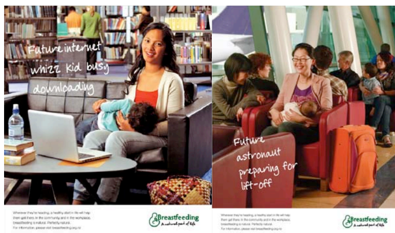
Figure 7. Breastfeeding. A natural part of life

Breastfeeding. A natural part of life (figure 7) photographie des femmes souriantes qui travaillent et allaitent leur enfant en même temps. Dans les légendes des images, on ne parle pas de l'allaitement mais de l'activité professionnelle, avec une orientation vers les compétences multitâches de la femme. Il y a donc une importance du cadre, des lieux publics, et du rôle de la femme, loin de la mère au foyer, avec une fixation sur le sujet et sa réussite.