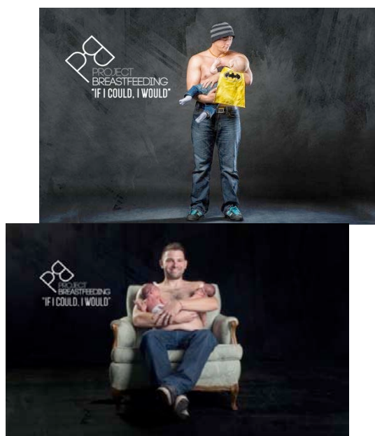
Figure 5. Project breastfeeding

D'une part, la campagne Project breastfeeding (figure 5), surfant sur l'univers symbolique de l'allaitement, valorise de manière connotée le rôle de la mère via le slogan, « If i could, I would » faisant écho au courant de féminisme différentialiste. D'autre part, ces affiches illustrent le lien entre père et bébé qui se tisse avec des hommes heureux et puissants, bousculant ainsi la représentation dominante de l'homme « macho qui cache ces émotions ». Le message du renversement des rôles sociaux accentue le rôle central de l'homme dans ce qu'on appelle couramment « le projet d'allaitement » symbolisé par le logo. L'allaitement ne peut être une pratique isolée et isolante.