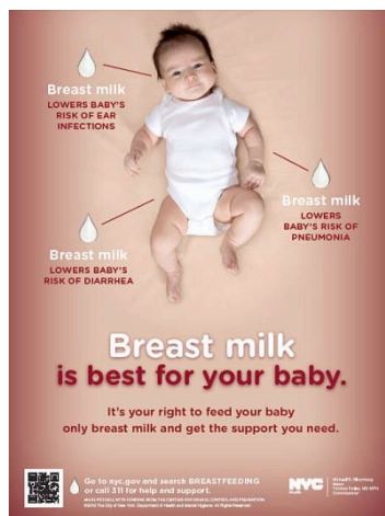
Figure 3. Breast milk is best for your baby

L'affiche Breastfeeding is not just for newborns (figure 2), est emblématique de la sémiologie du lien mère-enfant avec le choix des vêtements identiques, d'une tonalité de bleus, d'une même coupe de cheveu : un allaitement qui illustre les liens d'attachements mais qui rompt avec le discours social et culturel sur l'allaitement. On montre une autre position d'allaitement que celle de « la madone ». La mère ne regarde plus son enfant. Elle nous regarde d'un air confiant. L'enfant doit avoir dans les deux/trois ans, âge à partir duquel on commence à parler du sevrage naturel. Il y a peu de place au cadre situationnel mais une mère et son fils, rompant ainsi avec la théorie freudienne de l'Œdipe et illustrant plutôt la théorie de l'attachement de John Bowlby.