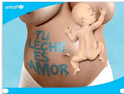
Figure 4. Tu leche es amor

Dans Breast milk is best for your baby appelée aussi Latch in NYC (image 3), la dimension figurative et discursive est prégnante. Elle apparaît à travers un bébé joufflu visiblement couché sur un matelas. Pas de mère mais pour palier à cela, le lait est imagé sous forme de goutte et le mot « milk » en blanc est itératif dans l’affiche. Le discours est négatif, il ne mentionne pas les bienfaits pour l’enfant ou pour la mère mais la baisse des risques encourus, en sous-entendu avec le lait artificiel. On valorise essentiellement le lait et ses effets par le registre figuratif analytique. Le discours se focalise sur l’objet, le bébé est une icône à lui seul.